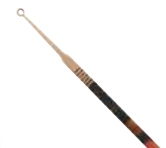
Cureta de Aço autoclavável