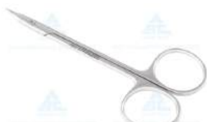
Tesoura Stevens Curva - ABC • AÇO INOXIDÁVEL AISI-420 • 10 ANOS CONTRA DEFEITOS DE FABRICAÇÃO