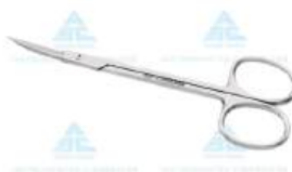
Tesoura Iris ou Gengiva Curva 12CM - ABC • AÇO INOXIDÁVEL AISI-420 • DISPONÍVEL NOS TAMANHOS 8 E 12 CM • 10 ANOS CONTRA DEFEITOS DE FABRICAÇÃO