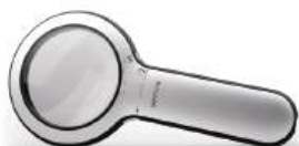
Lupa DerMLite Lumio 2