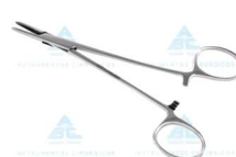
Porta Agulha Mayo Heger - ABC • AÇO INOXIDÁVEL AISI-420 • TAMANHO: 14CM • 10 ANOS CONTRA DEFEITOS DE FABRICAÇÃO