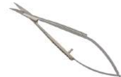
Tesoura CASTROVIEJO Curva - 10cm - BleyMed