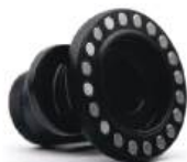
CLIP ADAPTADOR PARA SMARTPHONE OU TABLET DERMLITE