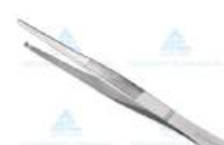
Pinça Anatômica Dente de Rato 12cm - ABC