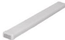
PONTA FRAZIONADA RETANGULAR 32 PONTOS DESCARTÁVEL 5un - LOKTAL