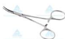
Pinça Halstead Mosquito Curva 10cm • POSSUI TRAVAS PARA MANTÊ-LA FECHADA • AÇO INOXIDÁVEL AISI-420 • PONTA CURVA, COM SERRILHA • 10 ANOS CONTRA DEFEITOS DE FABRICAÇÃO