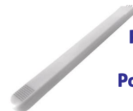
PONTA FRAZIONADA LINLY 64 MICRO PONTOS DESCARTÁVEL 10un - LOKTAL