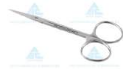
Tesoura Iris ou Gengiva Reta 12cm ABC