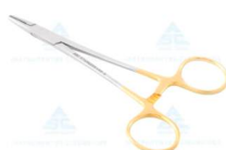
PORTA AGULHA Mayo Heger T/C (Videa) 12cm - ABC