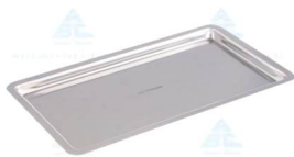
Bandeja ABC • AÇO INOXIDÁVEL • TAMANHO: 22X12X1.5CM • 10 ANOS CONTRA DEFEITOS DE FABRICAÇÃO