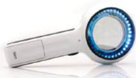
Lupa DerMLite Lumio