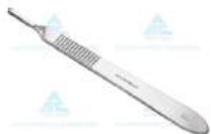
CAPO PARA BISTURI Nº3 - ABC • AÇO INOXIDÁVEL AISI-420 • TAMANHO: 13CM • 10 ANOS CONTRA DEFEITOS DE FABRICAÇÃO