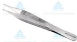
Pinça Adson com Dente 1X2 12CM - ABC • AÇO INOXIDÁVEL AISI-420 • TAMANHO: 12CM • 10 ANOS CONTRA DEFEITOS DE FABRICAÇÃO