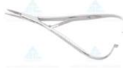
PORTA AGULHA Mathieu 11cm - ABC