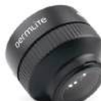
DERMLITE FOTO X