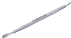
EXTRATOR DE Comedões Cureta • AÇO INOXIDÁVEL • ALÇA DUPLA TIPO ALEMÃ