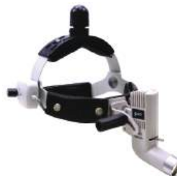
Fotóforo de LED HL 8000 MD