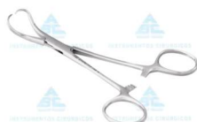
Pinça Backhaus 10cm (p/ campo) ABC