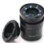
DERMLITE FOTO II PRO