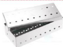
Estojo Perfurado 18x08x05CM - ABC • AÇO INOXIDÁVEL AISI-420 • 10 ANOS CONTRA DEFEITOS DE FABRICAÇÃO