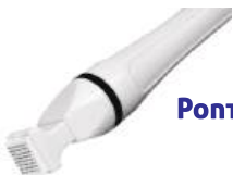
PONTA FRAZIONADA TUNGSTÊNIO 64 PONTOS FRAXX DESCARTÁVEL 10un - LOKTAL