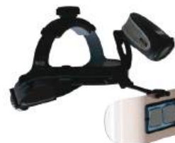
Fotóforo Profissional Syris v900L