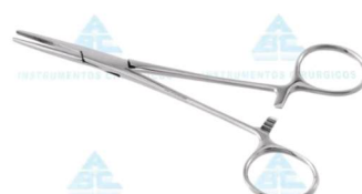
Pinça Kelly Reta 14cm - ABC • AÇO INOXIDÁVEL AISI-420 • TAMANHO: 14CM • 10 ANOS CONTRA DEFEITOS DE FABRICAÇÃO