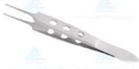
Pinça BISHOP com SERRILHA Reta 8cm - ABC